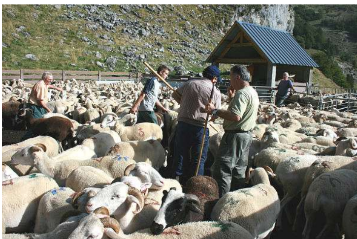
Estive de Cagire : rassemblement du troupeau pour trier les brebis prêtes à agneler et les redescendre en bergerie

Publicité : visitez le "blog" de notre ami Yvan Puntous http://images-du-pays-des-ours.blogzoom.fr/