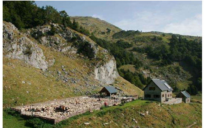
Cabane et refuge de Larreix (1470m)

Larreix, sur l'estive du Cagire, son parc de regroupement, sa superbe cabane restaurée avec tout le confort pour son berger (Yves Renaud), confort que certains n'ont pas chez eux dans la vallée, et à l'extrême droite le refuge des promeneurs.