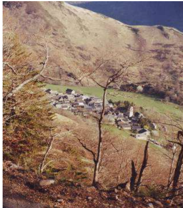
Village de Melles, territoire de Hvala et ses petits

Son site Internet : http://neanderthal-online.bebo.com/