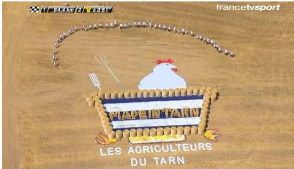
Troisième prix (ex-aequo) : FDSEA du Tarn