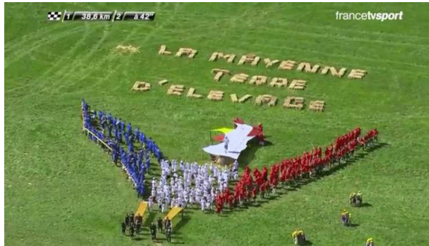
Premier prix : FDSEA de la Mayenne