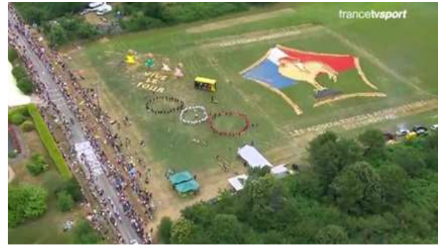
Deuxième prix : FDSEA du Morbihan