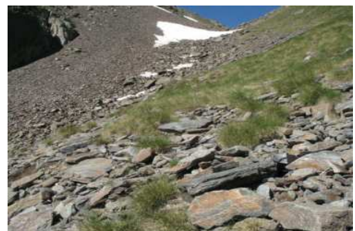
Habitat de Iberolacerta aurelioi Auzat (Ariège)

sont des petits lézards rupicoles endémiques de l'étage alpin des Pyrénées centrales en France, en Andorre et en Espagne. Leur aire de répartition est fragmentée sous forme d'une constellation de petites populations peu ou pas connexes possédant une structuration génétique forte. Ces trois espèces pourraient à moyen terme être victimes du réchauffement climatique qui menace le maintien de la ceinture alpine où se concentrent leurs habitats, généralement entre 2000 et 3000mètres. Les lézards des Pyrénées