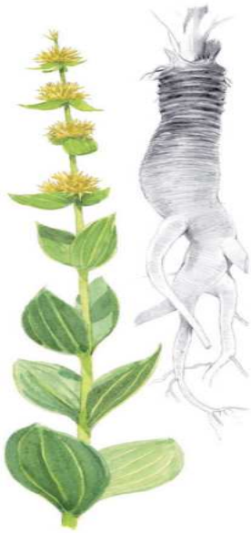
Marque-page Gentiane (recto)

Le Conservatoire botanique national des Pyrénées et de Midi-Pyrénées a créé une collection de 16 marque-pages destinés à tous ceux dont l'action peut contribuer à la préservation de plantes