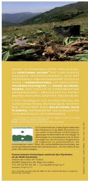
Marque-page Gentiane (verso)

présentant un intérêt scientifique, économique ou patrimonial. Les messages sont simples et vont à l'essentiel : d'abord, ce qui caractérise le plus la biologie ou l'écologie de la plante, et ensuite ce qui est recommandé de faire pour qu'elle survive et prospère. Des plantes pyrénéennes sont concernées : la Gentiane jaune, objet de cueillette sauvage et de valorisation économique, la Corbeille d'argent à gros fruits et le Genévrier thurifère, espèces menacées et protégées, présentent un intérêt scientifique majeur et font l'objet d'études par le Conservatoire botanique. Deux marque-pages sont spécifiquement dédiés au programme Ecovars+ : ils affichent la Brize moyenne et l'Anthyllide des Pyrénées, deux espèces utilisées pour la revégétalisation en altitude.