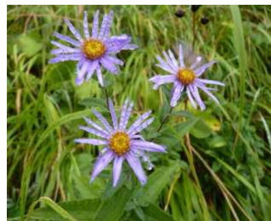
Asters des Pyrénées

Le Plan national d'action en faveur de l'Aster des Pyrénées a été validé par le Conseil National de Protection de la Nature (CNPN). Il doit être prochainement diffusé par le Ministère de l'écologie. Les premières initiatives ont été lancées par le Conservatoire botanique national des Pyrénées et de Midi-