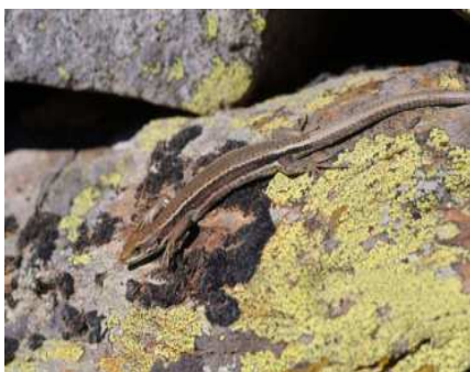
Iberolacerta aurelioi Auzat (Ariège) Alt 1950 m

Les trois lézards des Pyrénées ( Iberolacerta aranica , Iberolacerta aurelioi et Iberolacerta bonnali )