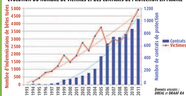
EVOLUTION DU NOMBRE DE VICTIMES ET DES CONTRATS DE PROTECTION EN FRANCE

Au printemps 1993 était rendue publique l'observation, constatée en novembre de l'année précédente, d'un couple de loups dans la zone centrale du parc national du Mercantour. Vingt ans plus tard, la population de cette espèce, protégée en vertu de la convention de Berne, avoisine les 250 individus en France. Elle a colonisé l'ensemble des Alpes, atteint les Vosges et le Jura, et progressé jusqu'en Lozère et dans les Pyrénées-Orientales. Ce retour du loup, quelque cinquante ans après son éradication, est entré frontalement en conflit avec les pratiques pastorales installées entre-temps, et provoqué des pertes de bétail en nombre croissant au fur et à mesure que les territoires colonisés par le loup se sont étendus. Leur population en France ayant manifestement atteint un effectif viable, un bilan s'impose de la politique à conduire à l'égard de cette espèce.