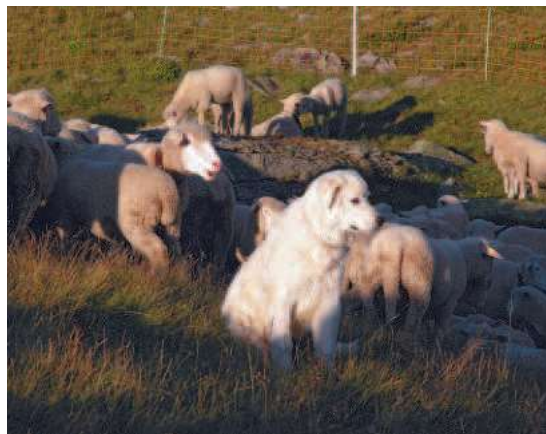
Chiens patous et enclos nocturnes sont des moyens efficaces pour infléchir l'impact du loup sur les troupeaux.