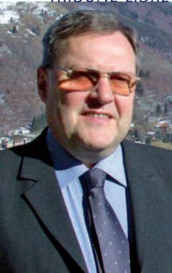
MAIRIE DE LA BRESSE

président de la communauté de communes de la Haute-Moselotte