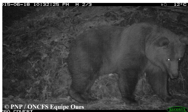
Photo automatique de Cannellito, le 18 juin 2015, sur la commune de Cauterets (65).