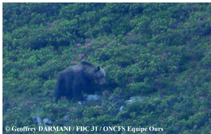
Pyros (boucle auriculaire bleue), le 18 juin 2015, commune de Melles (31). Après l'observation, le chasseur confie au technicien : « C'est vraiment un animal impressionnant et magnifique ! »

Une sélection de photos et vidéos automatiques, classée par mois, est maintenant consultable sur notre site internet : http://www.oncfs.gouv.fr/Photos-et-vidéos-dOurs-Brun-dans-les-Pyrenees-amp-nbsp-ru533/Images-dOurs-brun-en-2015-ar1804