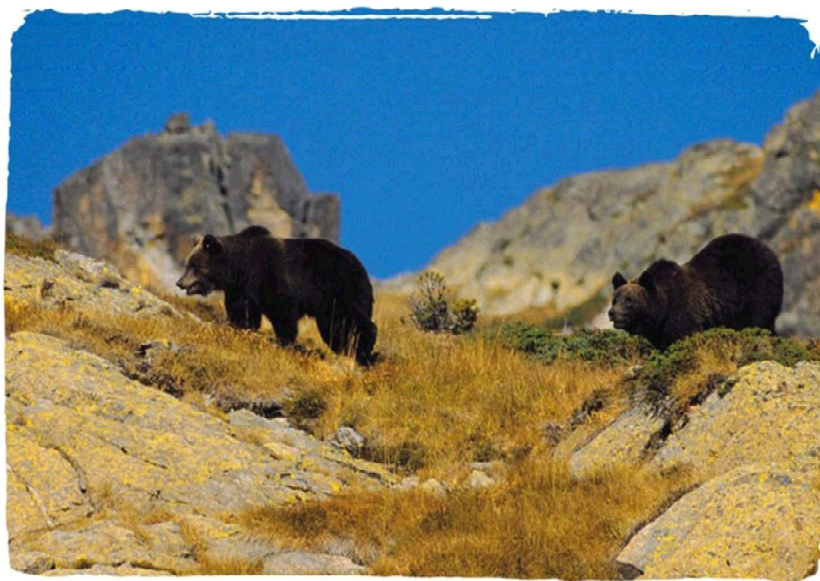
Boutxy et Caramelles, oursons de Mellba, nés en 1997 de la réintroduction dans les Pyrénées Centrales .