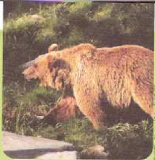
© W. P. Caron / MOUZE QUATRE